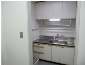
給湯室（冷蔵庫・電子レンジはありません）