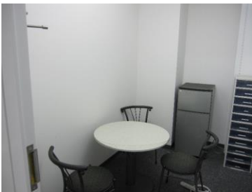
講師室兼面談室（室内）